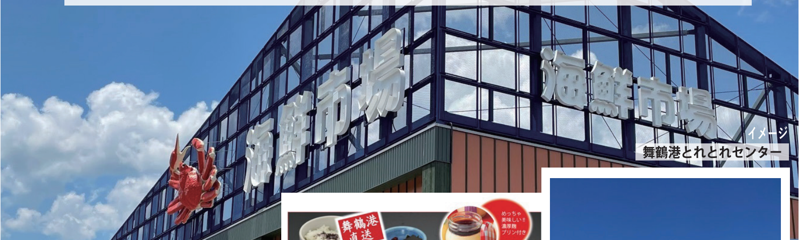
舞鶴港とれとれセンター

舞鶴観光の代表「赤れんがパーク」散策と、名店「いけす料理 卑弥呼 舞鶴」の海鮮ランチをお召し上がりいただきます。 とっておきの京都エリア 西京区の松尾大社参拝で今年一年の締めくくり！年の瀬にうれしい山科区の老舗 鶴喜そば♪