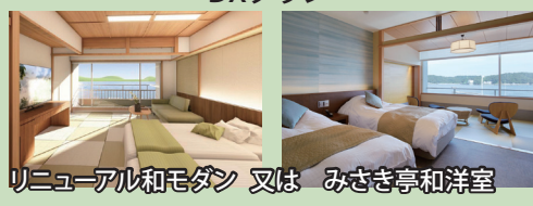
リニューアル和モダン 又は みさき亭和洋室