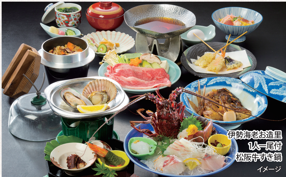
伊勢海老お造り 1人1尾付 松阪牛すき鍋 イメージ

船で行く・ハートアイランド(離島)の温泉宿 穏やかな的矢湾に浮かぶ和の風情溢れる宿