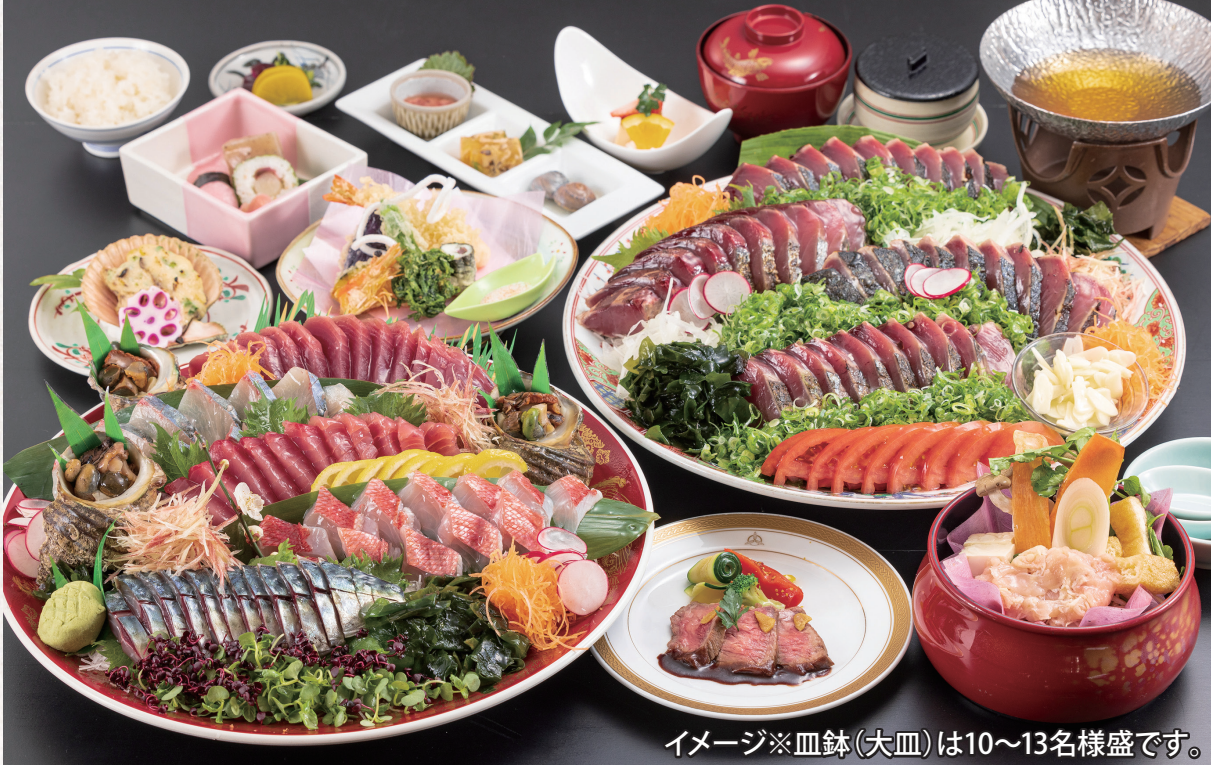
イメージ※皿鉢(大皿)は10～13名様盛です。

高知市内中心部唯一の天然温泉旅館です。壺号館(禁煙棟)は 2020年秋オープン、建物全体は2021年秋リニューアルオープン