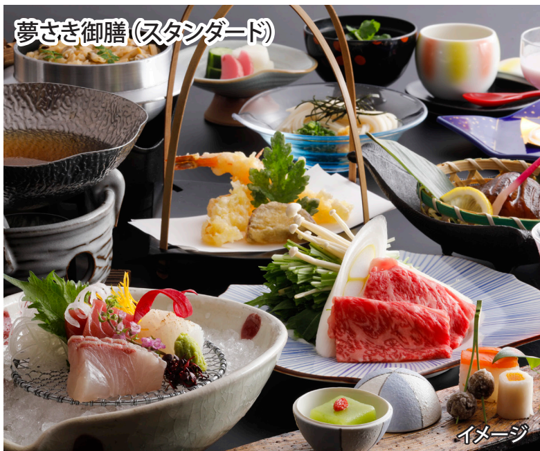
夢さき御膳(スタンダード)