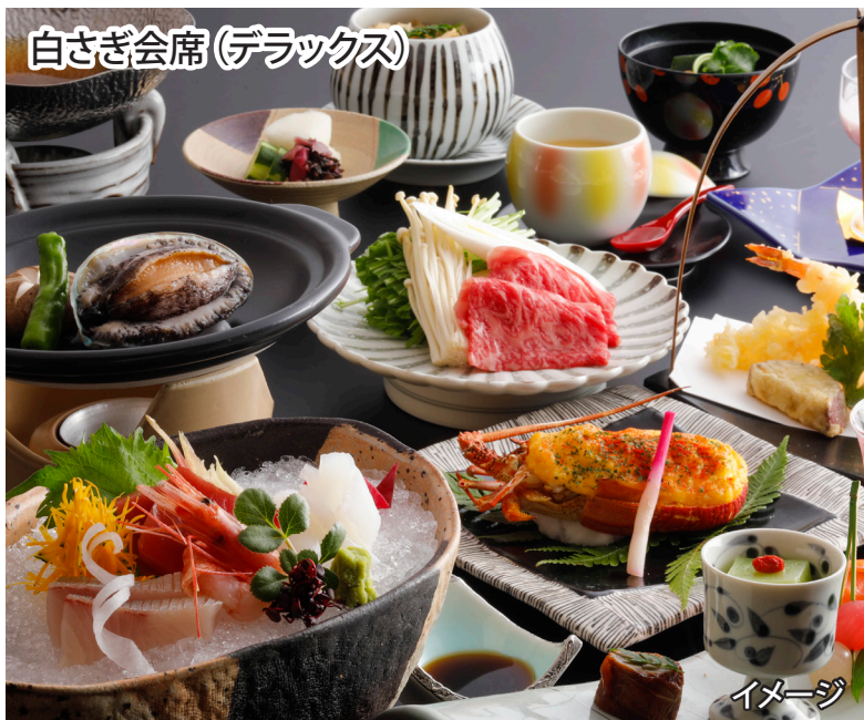
白さぎ会席(デラックス)