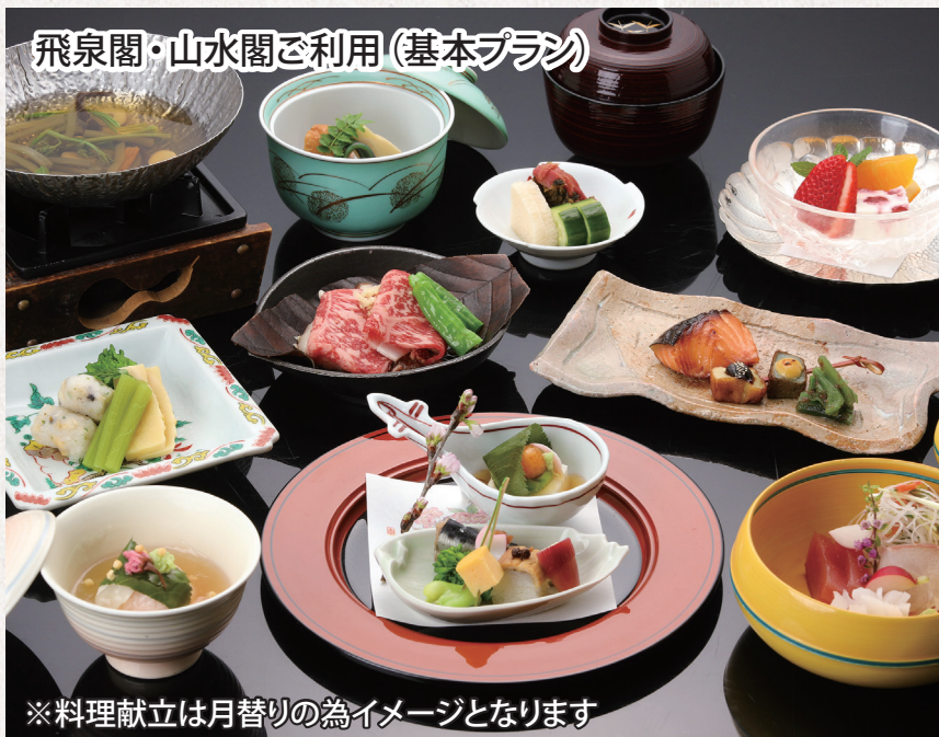
飛泉閣・山水閣ご利用(基本プラン)

日本三名泉下呂温泉で、当館自慢の 総檜大浴場・野天風呂・展望大浴場をお楽しみ下さい。