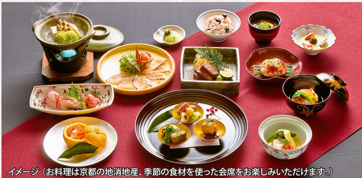
イメージ (お料理は京都の地産地産、季節の食材を使った会席をお楽しみいただけます。)

京都駅から近く、地下910mから汲みあげる自家源泉の湯で旅の疲れを癒し、心ゆくまで京湯元ハトヤ瑞鳳閣をお楽しみください。