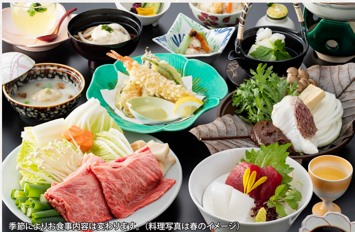
季節によりお食事内容は変わります。(料理写真は春のイメージ)