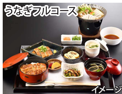
うなぎフルコース