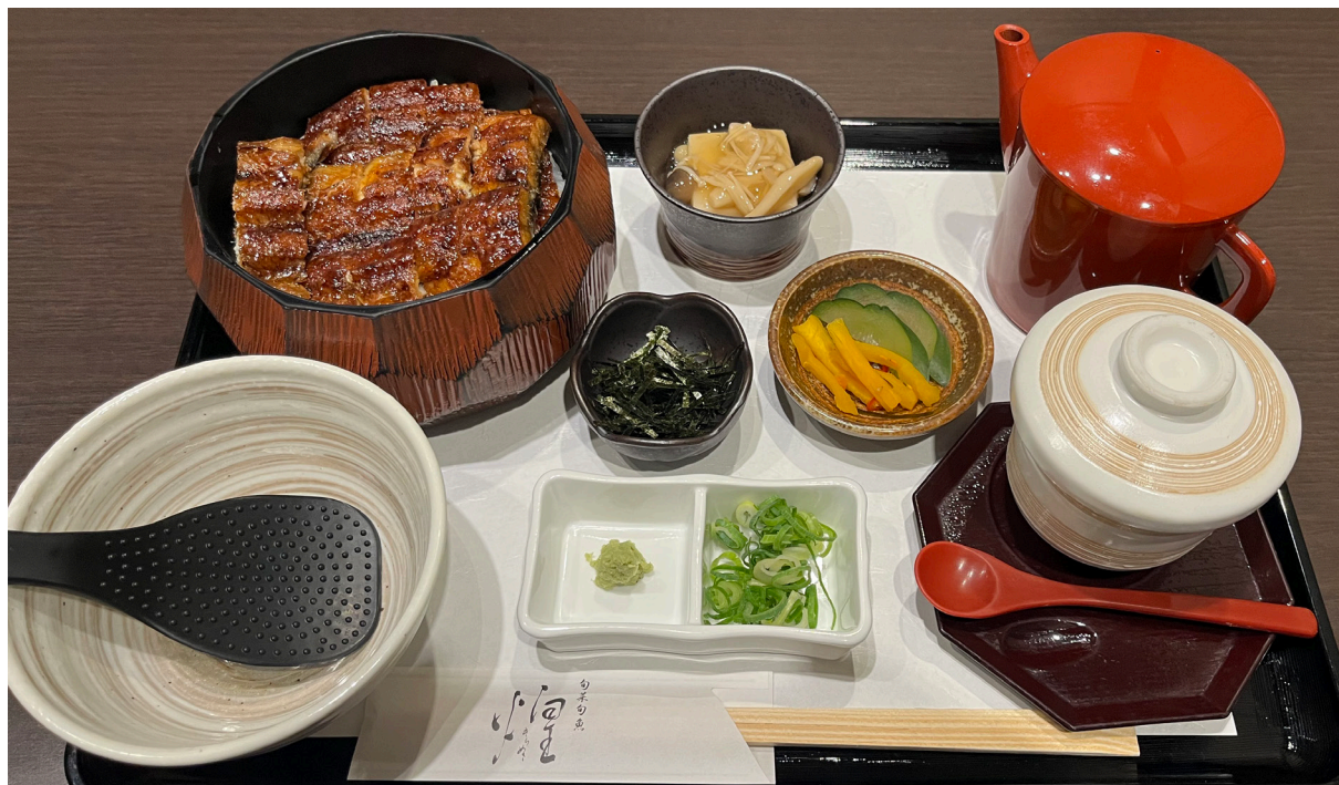
※写真は「うなぎ ひつまぶし(上)」のものです

食材にこだわり、誰もが「おいしい」と思えるお料理の数々を提供し、皆様に心地よい空間をご提供いたします。