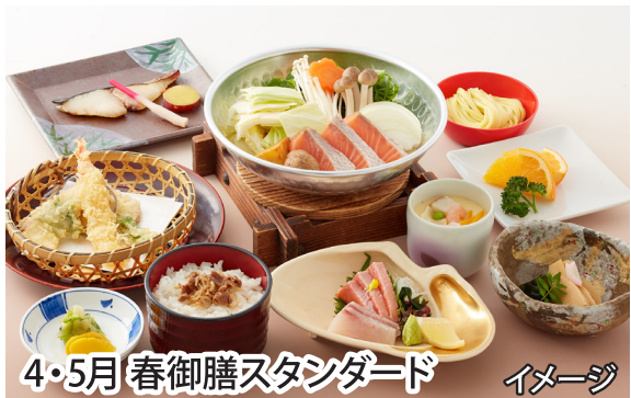
4・5月 春御膳スタンダード