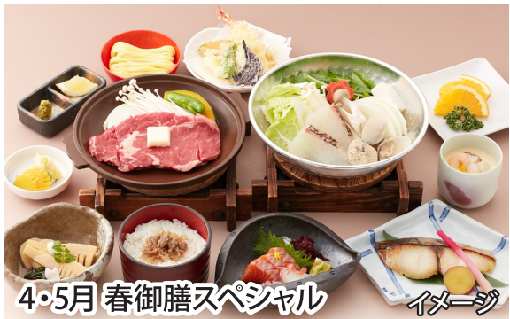
4・5月 春御膳スペシャル