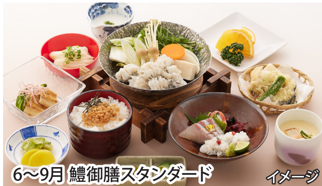
6～9月 鱧御膳スタンダード