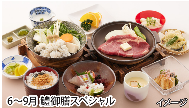
6～9月 鱧御膳スペシャル