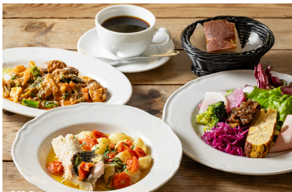
鮮魚のアクアパッツァ