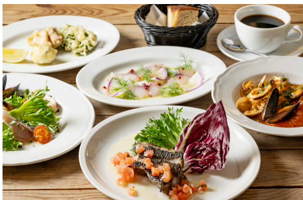
シーフードコース