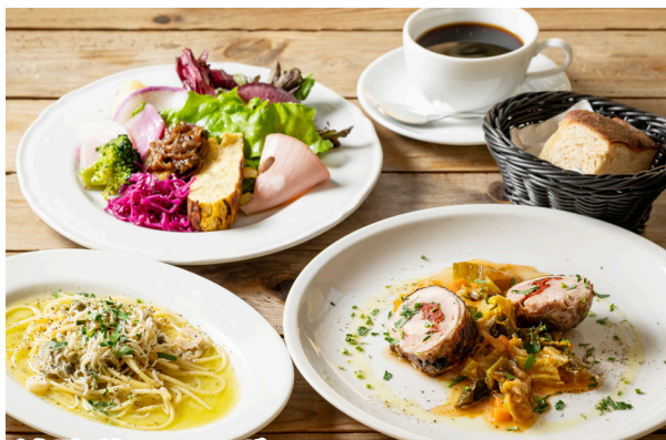
淡路鶏のインボルティニ