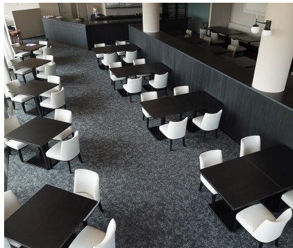
デラックス (フィグ)